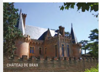
CHÂTEAU DE BRAX