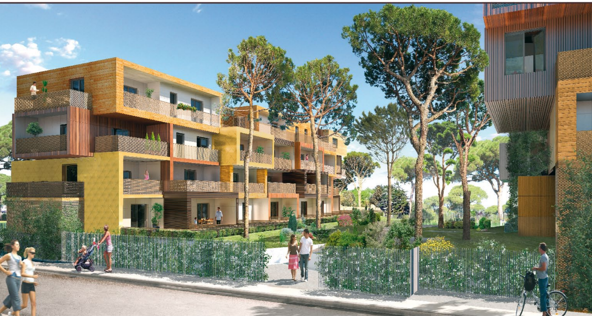
Le coeur de la résidence (concept architectural)